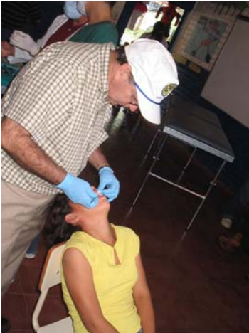
Atención odontológica realizada en la Comunidad Hermosa Provincia.

Fotografías de Jornadas realizadas por el Club Rotario Santa Tecla: