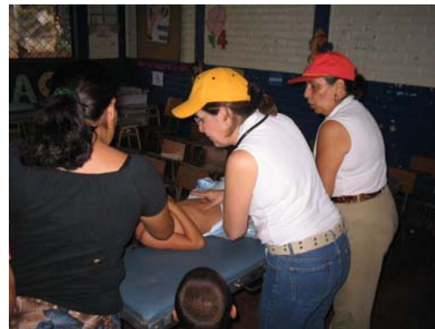
Entrega de medicamentos, ropa y víveres a los beneficiarios.